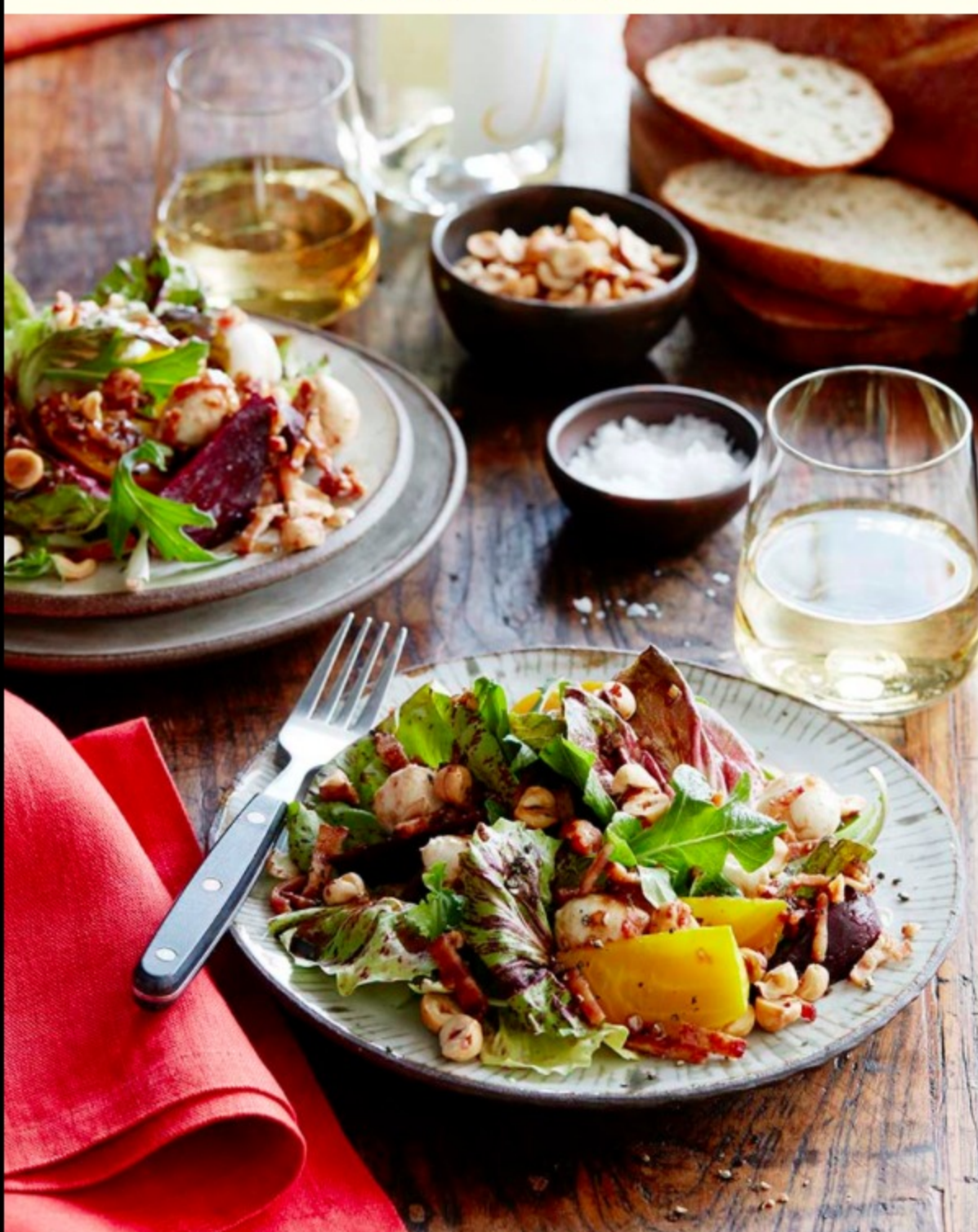
허니 베이컨 소스를 곁들인 구운 비트, 헤이즐넛, 신선한 모짜렐라